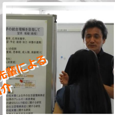
先生や先輩による 研究紹介