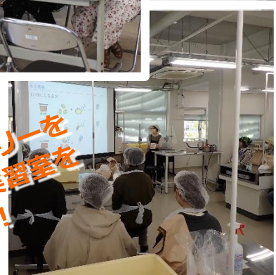
スタンプラリーを しながら実習室を のぞきみ!